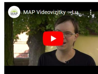
vojenský a bezpečnostní analytik, publicista