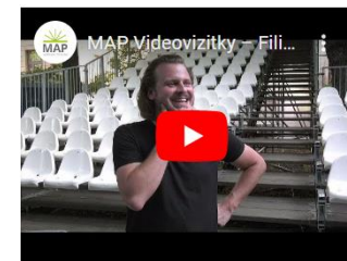
herec, autor, moderátor, zdravotní klaun